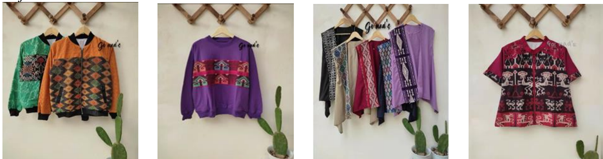
Gambar 1 Baju Berbahan Kain Tradisional Wastra Indonesia

Menurut Weygand et al (2018), ada berbagai bentuk perusahaan dalam dunia usaha yaitu perusahaan perseorangan, persekutuan (firma) dan korporasi atau perseroan terbatas. Apabila dilihat usaha Go Nads ini termasuk sebagai usaha perseorangan. Kieso et al (2019) menjelaskan bahwa satu unit usaha harus membuat laporan keuangan yang terdiri dari laporan laba rugi, laporan perubahan ekuitas atau laporan saldo laba, laporan posisi keuangan, laporan arus kas, dan catatan atas laporan keuangan.