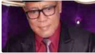
Pentingnya Kolaborasi antara Pengurus Yayasan dengan Pengurus Masjid