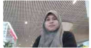
Aktivis Global Sumud Flotilla 2.0 Disiksa dan Dilecehkan, Kekejaman Israel Semakin...