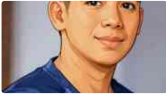
Hari Lahir Pancasila: Menghidupkan Kembali Semangat Founding Fathers...