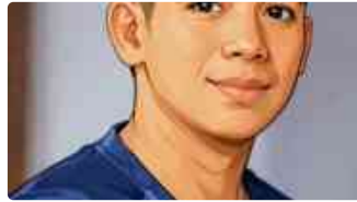
Saatnya Masyarakat Sipil Mengawal Reformasi Aturan Pemilu 2029