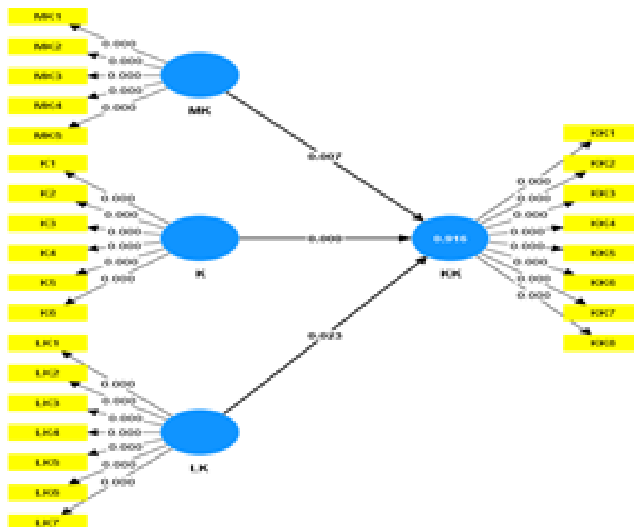
Gambar 2. Hasil analisis bootstrapping

Menurut Haryono (2016), Uji path coefficient ini bertujuan untuk mengetahui apakah ada pengaruh antar variabel independen dengan variabel dependen. Uji ini memiliki nilai berkisar -1 sampai +1. Tanda negatif (-) artinya menunjukkan variabel independen terhadap variabel dependen memiliki pengaruh yang negatif. Tanda positif (+) artinya variabel independen terhadap variabel dependen memiliki pengaruh yang positif. Jika t-statistic > 1,96 dan p-value < 0,05 maka hipotesis diterima. Jika t-statistic < 1,96 dan p-value > 0,05 maka hipotesis ditolak.