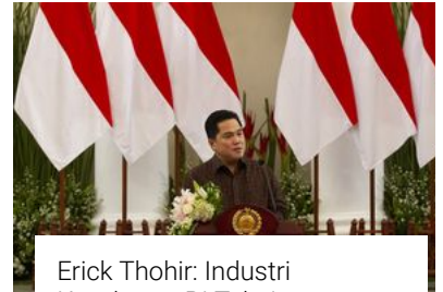
Erick Thohir: Industri Kesehatan RI Tak Jago Kandang