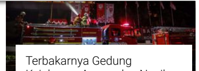
Terbakarnya Gedung Kejaksaan Agung dan Nasib Berkas Perkara...