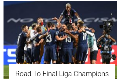
Road To Final Liga Champions 2019-2020, Paris Saint-Germain Ukir Sejarah