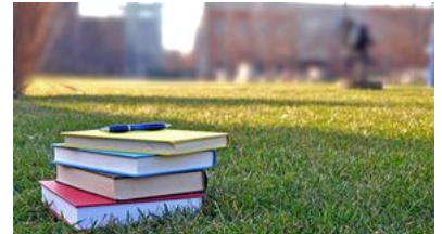
Beredar Isu Uang Pangkal Rp 87 Miliar, Ini Penjelasan Undip