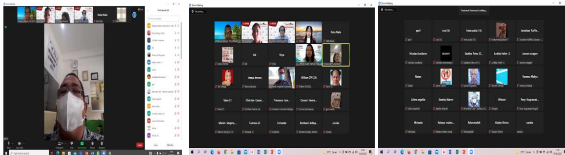
Foto kepala sekolah ketika membuka kegiatan PKM dan sebagian peserta yang hadir, diambil 15 Februari 2022

Kegiatan PKM “Belajar Berpikir Kritis Bersama Siswa-Siswi SMA Bhinneka Tunggal Ika Jakarta” ini, telah dilaksanakan secara daring dengan menggunakan zoom meeting pada tanggal 15 Februari 2022 lalu dengan jumlah peserta 67 orang, terdiri dari 60-an murid dan sisanya adalah para guru yang ikut mendampingi para murid. Acara dimulai dengan kata sambutan oleh Kepala Sekolah SMA Bhinneka Tunggal Ika Jakarta, bapak Edy Fredy S.Ag. Dalam sambutannya bapak Edy Fredy mengingatkan kepada para siswa agar serius mengikuti kegiatan PKM ini karena membekali para siswa dengan kemampuan-kemampuan yang berguna bagi keberhasilan belajar, dunia kerja, dan untuk hidup secara keseluruhan.