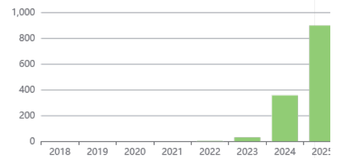
Journal By Google Scholar