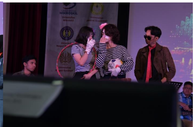
Penampilan Drama Mahasiswa/i Untar