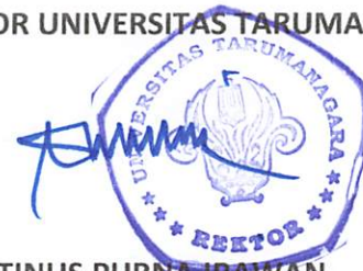
AGUSTINUS PURNA IRAWAN