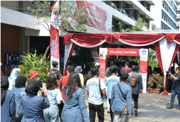
Kedatangan Peserta PSMN 2022