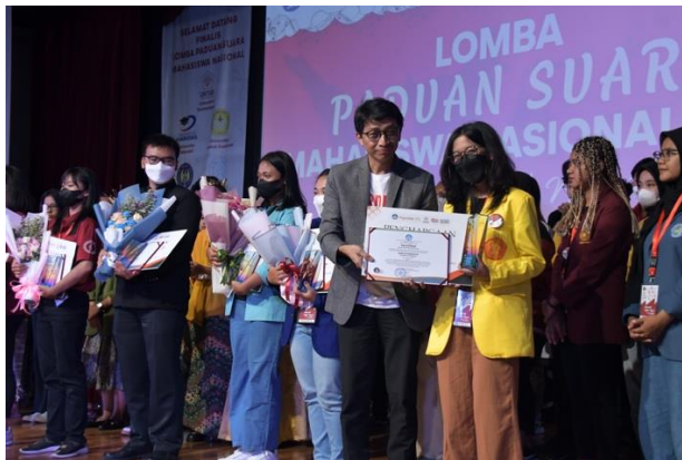
Pemberian Piagam Kepada Juara 1 PSMN 2022.