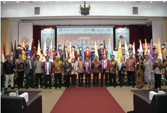
Foto Perwakilan Peserta bersama Juri dan panitia Penampilan Peserta PSMN 2022