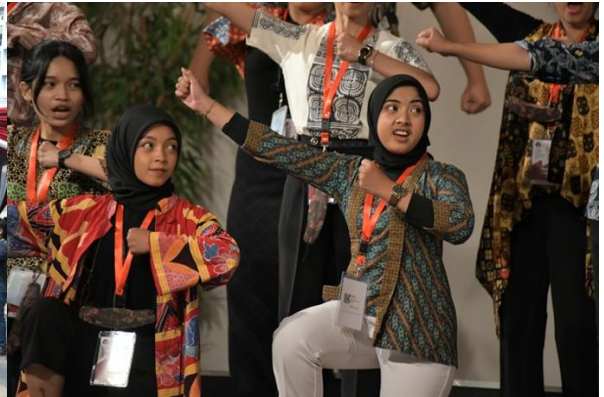
Prosesi Test Panggung oleh Peserta