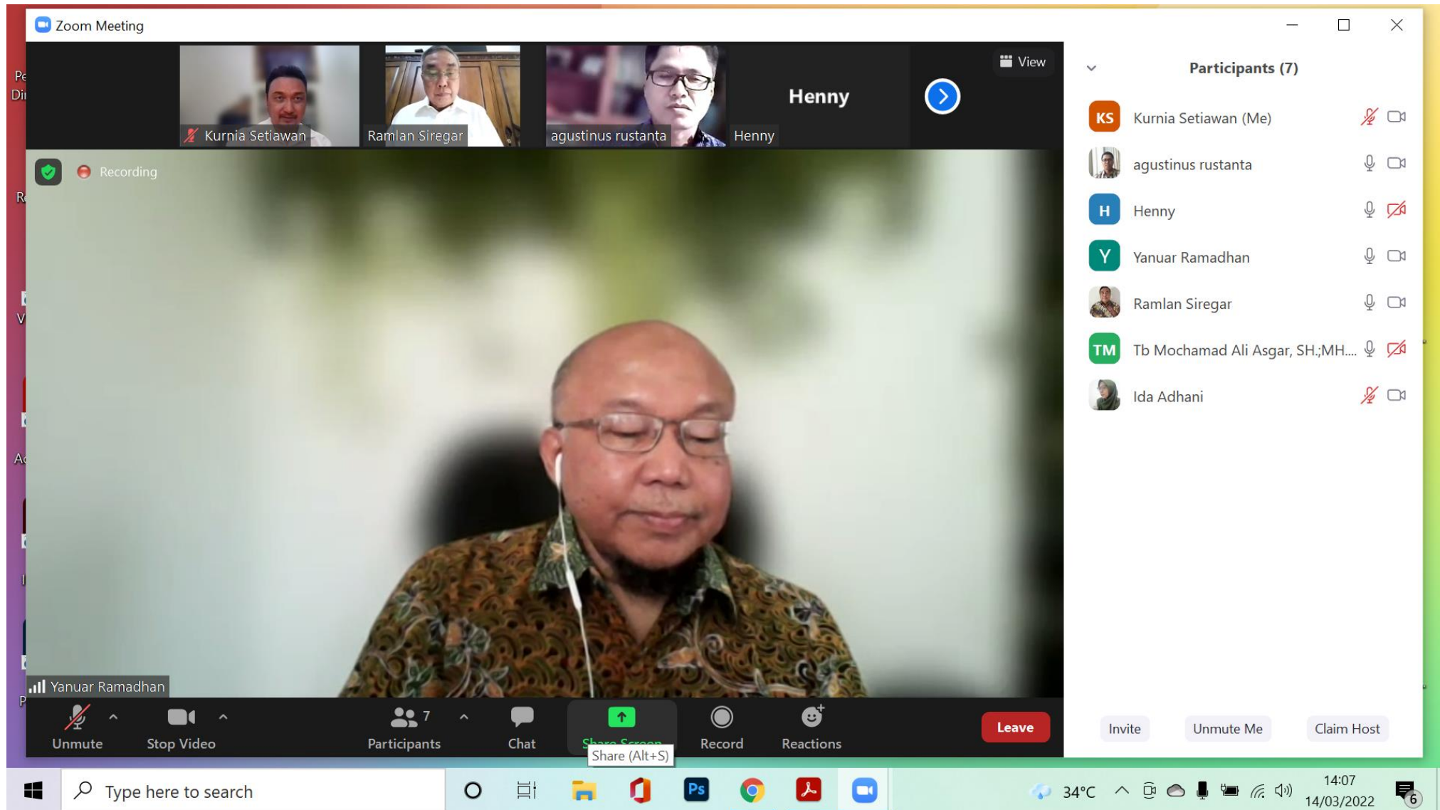
Rapat Persiapan Webinar ABP PTSI, Jakarta Senin 14 Maret 2022